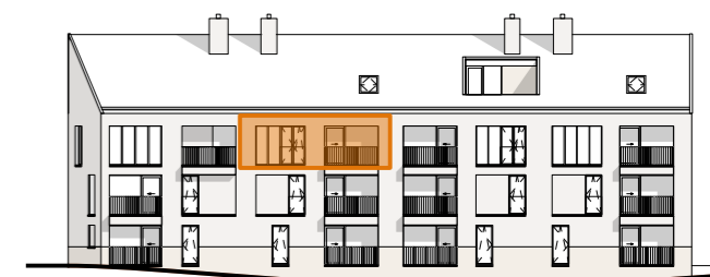
ACHTERGEVEL SCHAAL 1/500